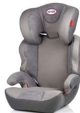
MaxiProtect ERGO SP