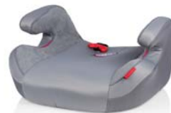
SafeUp XL Cormfort

In unterschiedlichen Farben erhältlich. In different colors available. Имеется в продаже разного цвета.