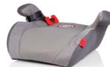
SafeUp M ERGO