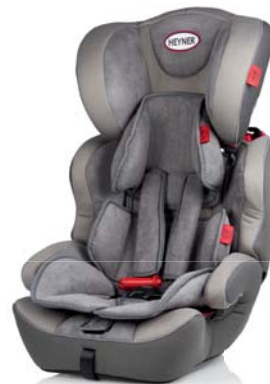
MultiProtect ERGO SP